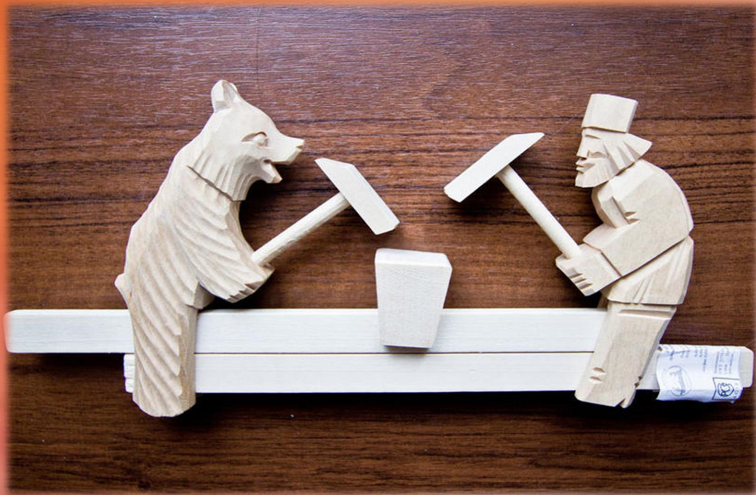
Символ промысла богородская игрушка «Кузнецы»